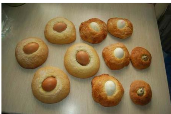
Imagen 6: Los Garabazos tradicionales se elaboran con masa de torta de naranja y/o masa de torta de Pascua. Para los más pequeños, se elaboran garabazos de menor tamaño y con huevo de codorniz.