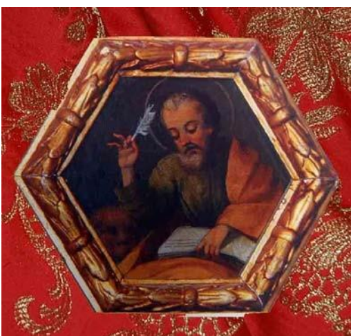
Imagen 7: San Marcos en una de las pechinas de la cúpula del camarín del Santuario de Santa Eulalia.

Detalle de algunas de las representaciones de San Marcos Evangelista en Totana: