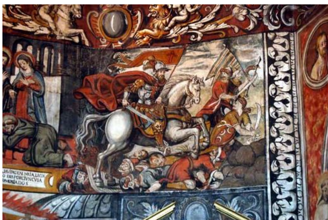
Imagen 2: En el muro del Evangelio, encontramos una pintura que nos evoca la Batalla de Clavijo.

Y lógicamente, en la impronta de la Orden de Santiago en nuestra tierra, podríamos hallar el origen de la tradición del día de San Marcos en Totana, al igual que hallamos la del patronazgo de Santiago el Mayor. Es cierto que no disponemos de momento de ningún dato concreto que nos muestre desde cuándo existe la devoción a San Marcos en Totana, pero sí que podemos conjeturar, que la devoción popular a este Evangelista en nuestra localidad, podría tener su origen, -o al menos influencia-, en los dos Santos bajo cuyo patronazgo se hallaban los dos grandes Prioratos 2 que tenía la Orden de los Caballeros de Santiago en nuestro país: el de Santiago de Uclés y el de San Marcos de León.