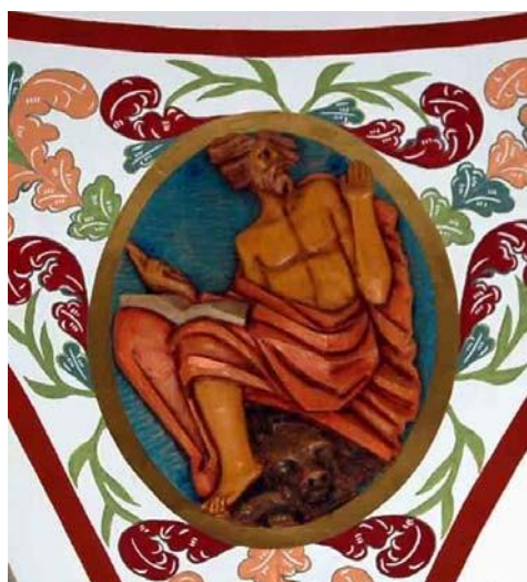
Imagen 8: San Marcos en una de las pechinas de la cúpula de la Capilla del Santísimo en la Parroquia de las Tres Avemarías.