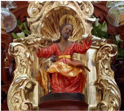
Imagen 9: San Marcos en el trono de la Hermandad de San Juan Evangelista.